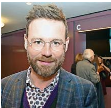
Amüsierte sich köstlich: Moderator Nik Hartmann.