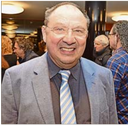
Lachte sich kaputt: Neo-Rentner Beni Thurnheer.